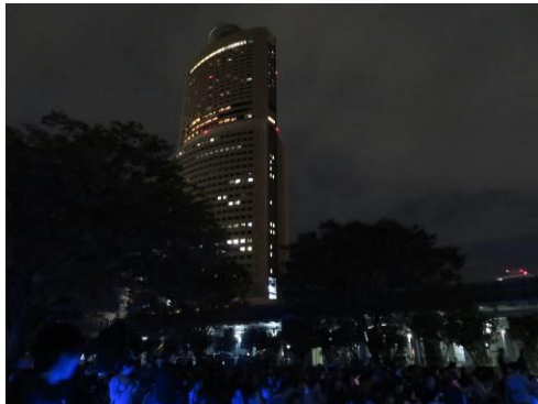
アクトタワー & ご来場の皆様