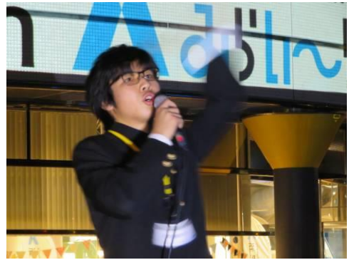
掛川西高校パソコン部様