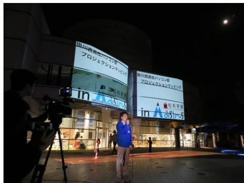
浜松科学館様よりご挨拶