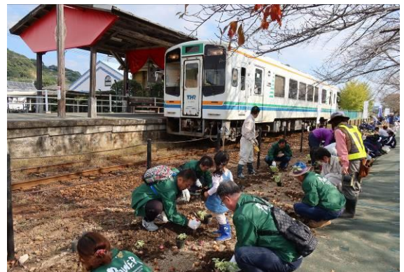
天竜浜名湖鉄道車両 & メンバー植栽作業奮闘中