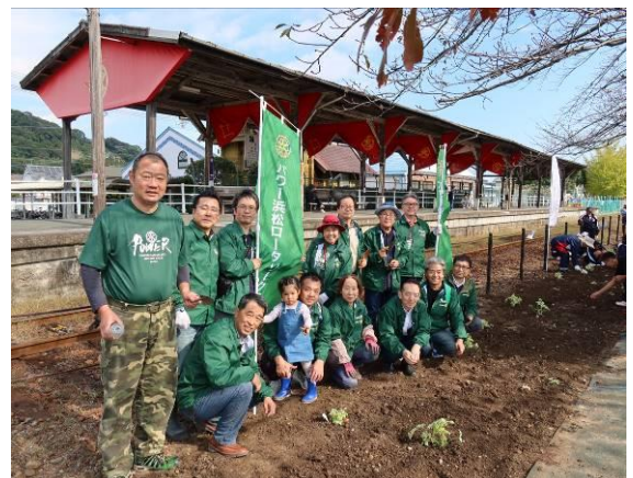
植栽作業終えて参加メンバーで記念写真