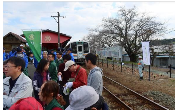
天竜浜名湖鉄道気賀駅ホーム