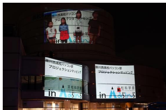
浜松科学館 掛川西高校パソコン部 パワー浜松ロータリークラブ協力