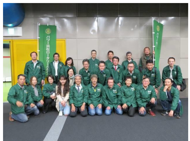
プロジェクションマッピング NIGHT 無事に終了 片付けが終わり参加メンバーで記念写真