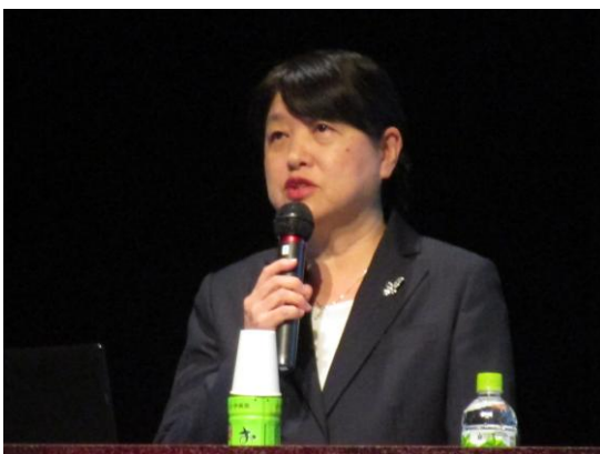
講演する奥山会員